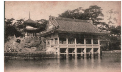
和歌公園「観海閣」の復元的整備 （大正頃の観海閣：和歌の浦学術調査報告書より）

併せて、現場見学会の開催や木造化事例等の情報を提供することにより、市町村建築物の木造化促進に取り組んでいます。