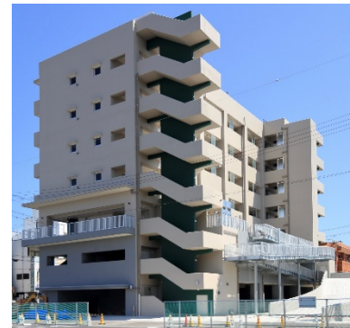
県営住宅串本団地（令和6年5月竣工）