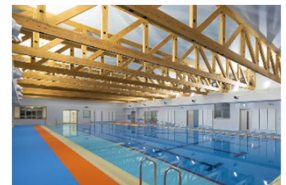
障害児者サポートセンター屋内プール