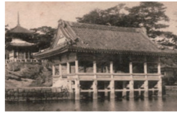
和歌公園「観海閣」の復元的整備 （大正頃の観海閣）

併せて、現場見学会の開催や木造化事例等の情報を提供することにより、市町村建築物の木造化促進に取り組んでいます。