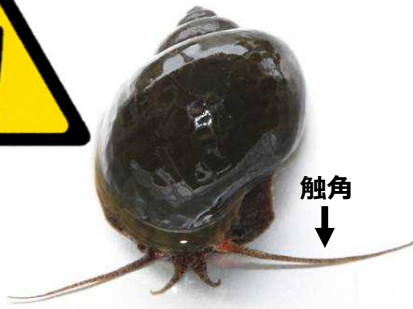
ジャンボタニシ (スクミリングガイ)