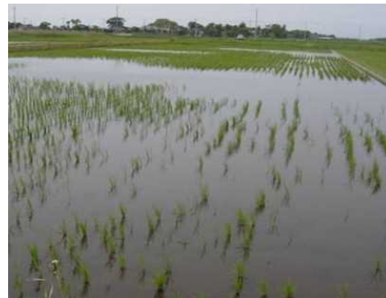
食害を受けた水田