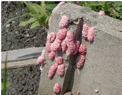
用水路（水口）の卵塊