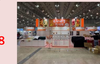
2025年の和歌山県ブースの様子