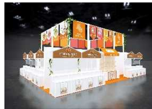
【和歌山県ブースイメージ】