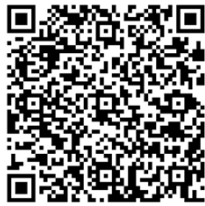
「日本酒マッピング図」