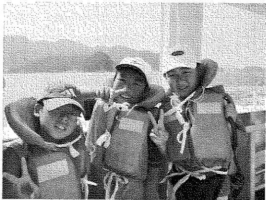
海の調査体験 (調査船上)