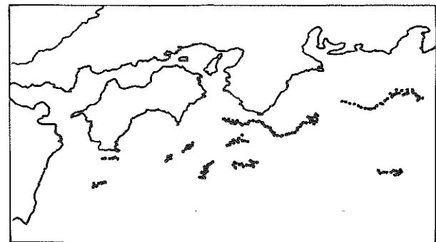
図3 漁場探索マップ