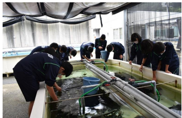
あわび類稚貝への給餌体験