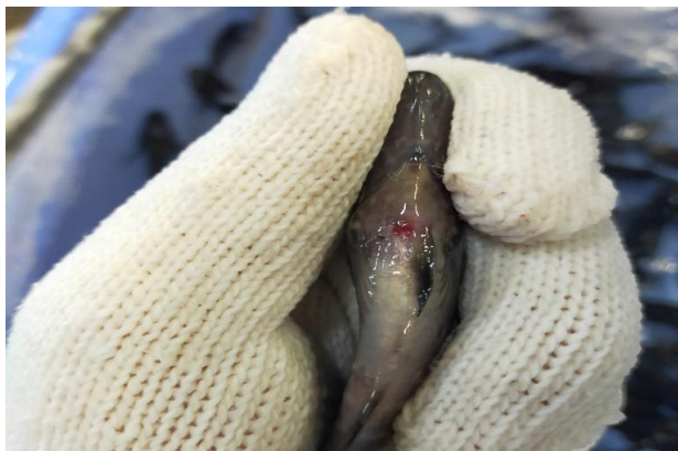
くえ種苗の腹鰭抜去