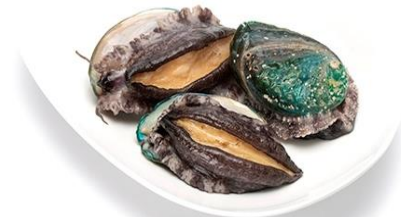
紀州アワビ紀和味(養殖)