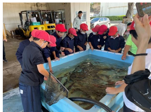
漁業士連絡協議会によるタッチプール