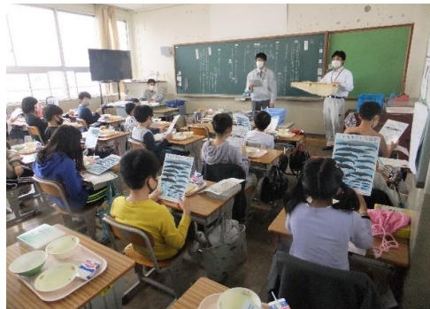
くじらの出前授業