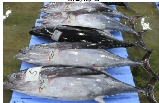
さくらびんちょう