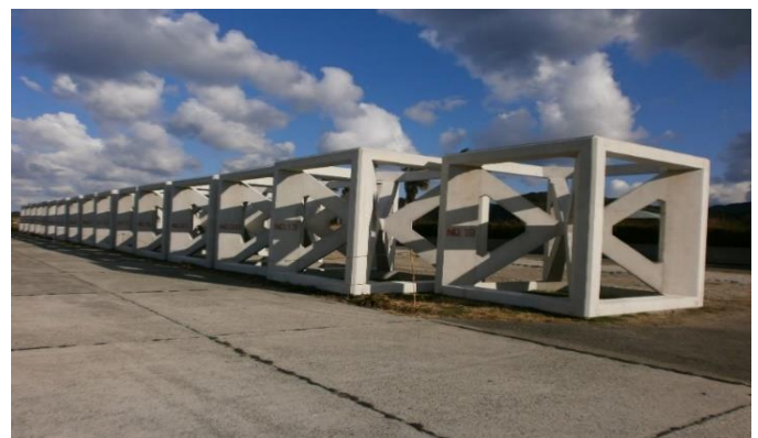
コンクリート魚礁