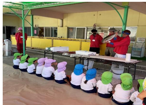
漁業士連絡協議会による魚食普及活動