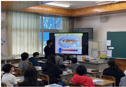
「魚の骨を知って楽しくおいしく食べよう」出張講座