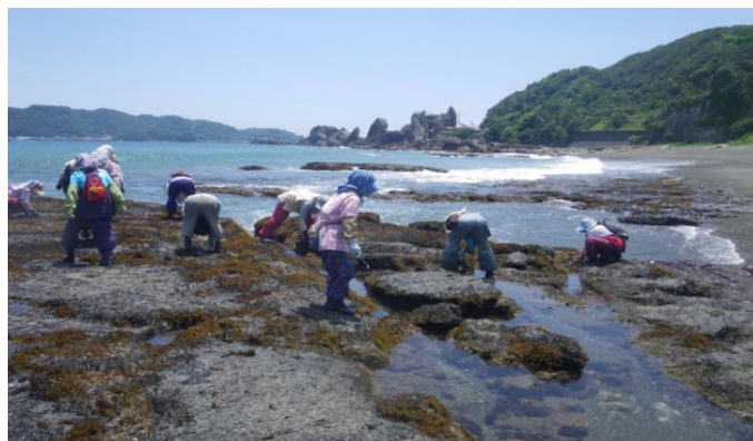
ひじき場の造成(磯掃除)