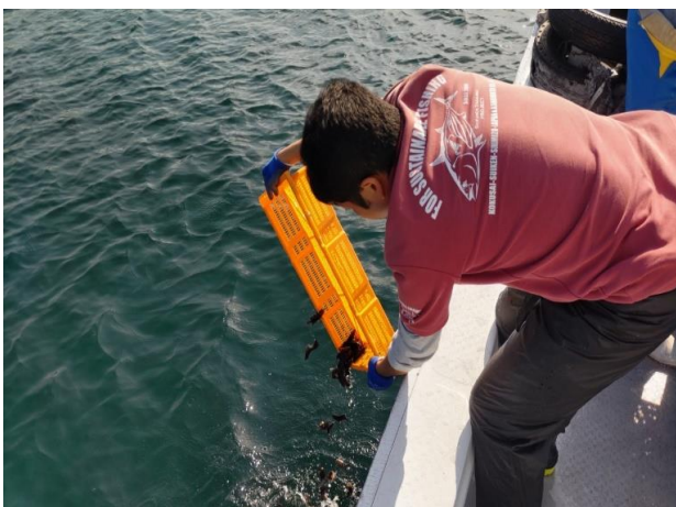
きじはた種苗の放流