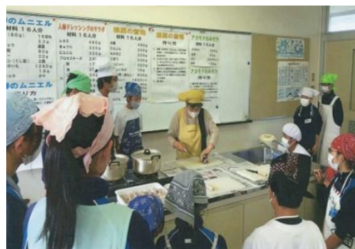
漁協女性部による小学校での料理教室