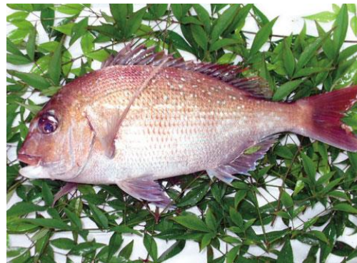
加太の一本釣り真鯛