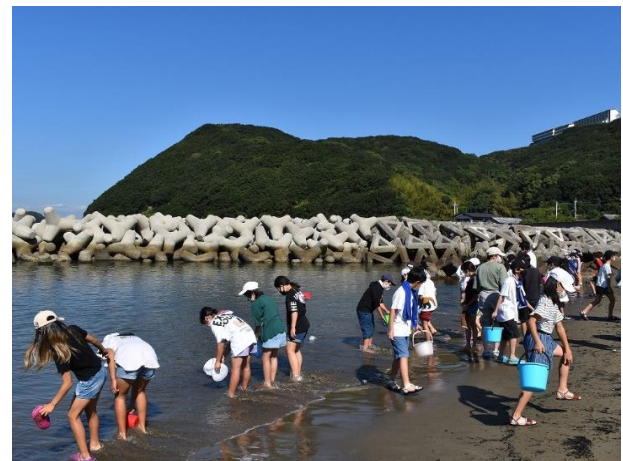
いさき稚魚の放流体験