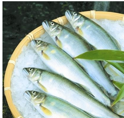
紀州仕立て鮎(養殖)