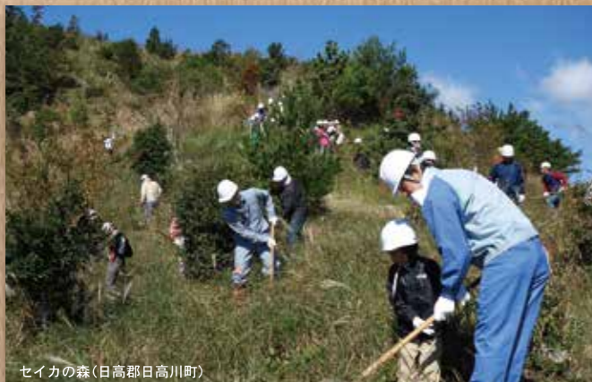
セイカの森(日高郡日高川町)

この車両の導入により、従来以上に道路の美化が進むとともに粉じんの飛散防止に効果を上げています。