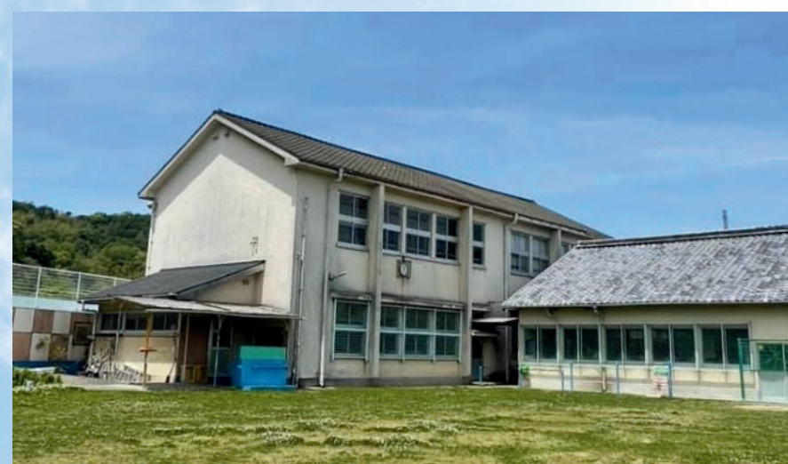
和歌山市に遺る唯一の 木造校舎の小学校「吉原分校」