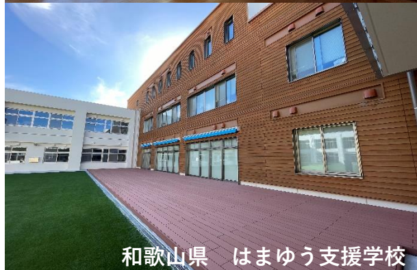
和歌山県 はまゆう支援学校