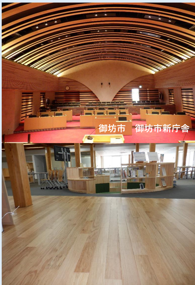
御坊市 御坊市新庁舎