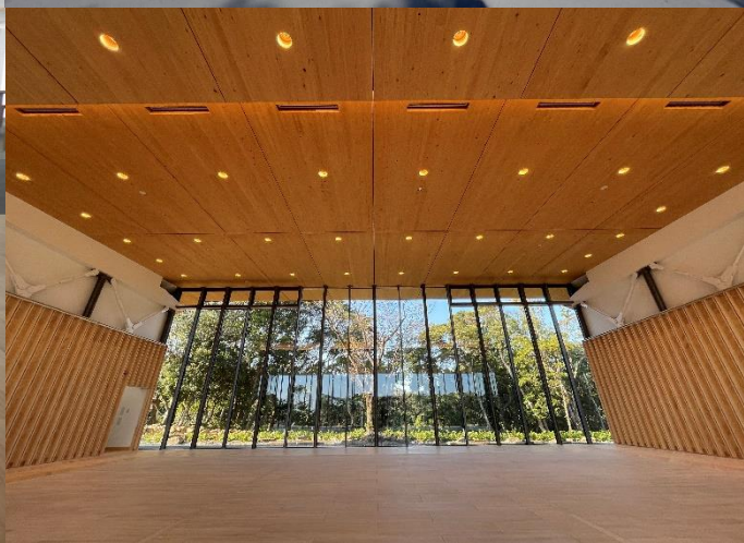
太地町 国際鯨類施設