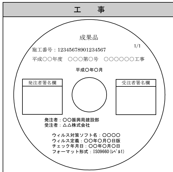
図5 CD-Rのラベルイメージ