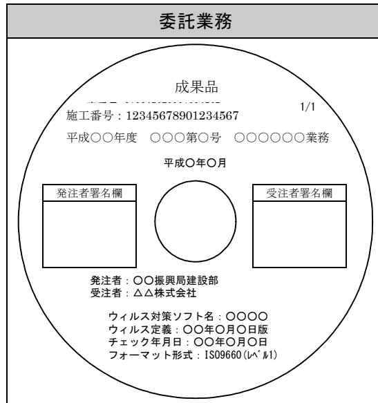
図3 CD-Rのラベルイメージ