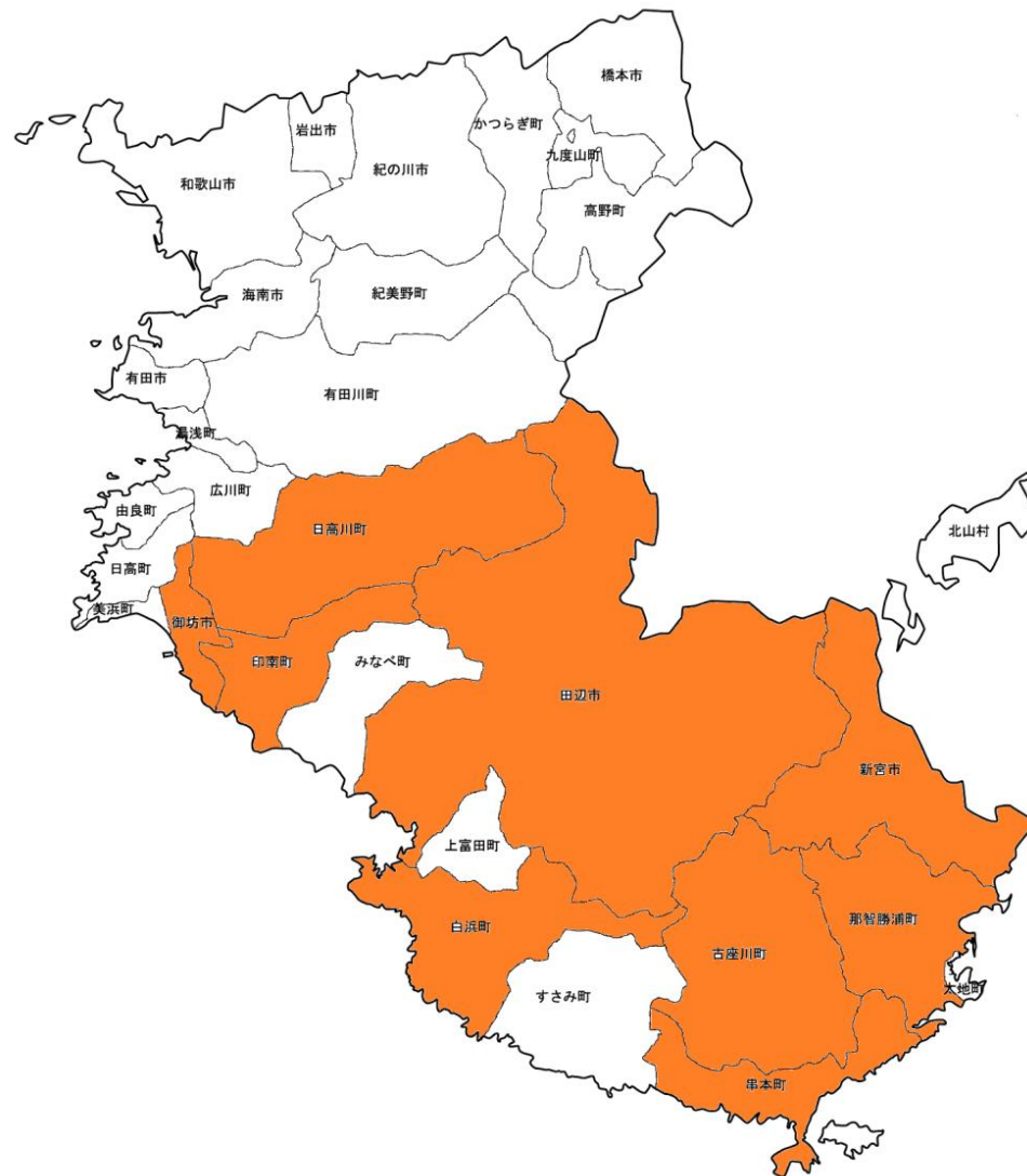
図1 紀南和牛改良組合