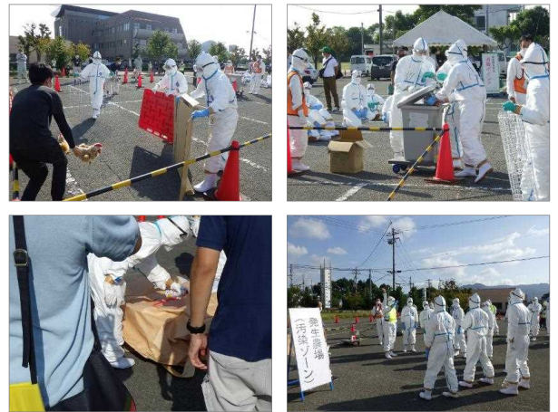
図4 農場作業訓練の様子