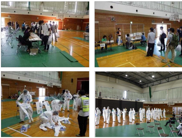
図1 動員者集合場所運営訓練の様子