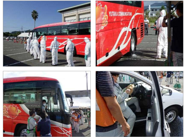
図2 消毒ポイント運営訓練の様子