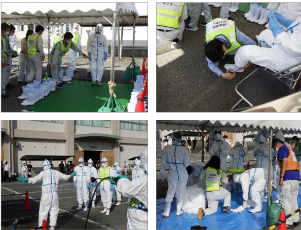
図3 現地防疫センター運営訓練の様子