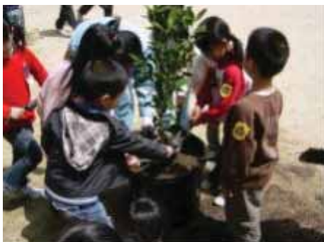
5月上旬に一斉に体験