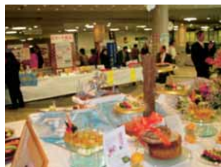
県産物を使ったシェフの料理展示