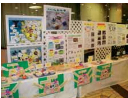
地場産物を使った学校給食展示