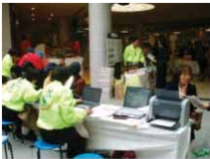
栄養診断・食事バランス診断コーナー