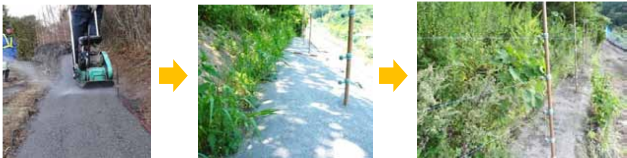
散水と転圧による施工