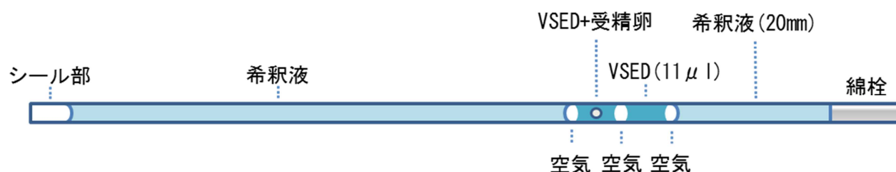
図1 VSED 法のストロー構成

ガラス化保存には0.4%牛血清アルブミン加mPBSを基礎媒液とし25%エチレングリコールと25%ジメチルスルホキシドを添加した溶液〔以下 VSED (Vitrification Solution consist of Ethylene glycol and Dimethyl sulfoxide)〕を用いた。ストロー内の希釈液として5%エチレングリコール、0.15Mスクロース、17.4%牛胎子血清を添加したmPBSを用いた。凍結は引田ら（2009）の方法を参考にした。プラスチックシャーレ上の50%VSED小滴（VSEDを基礎媒液で等量希釈、100 \mu l）中で受精卵を室温60秒平衡したのち、100%VSED小滴（100 \mu l）中に受精卵を移し平衡液を洗浄後、直ちに次の100%VSED小滴（11 \mu l）に移した。あらかじめ希釈液とVSED11 \mu lを吸引しておいたストローへ小滴ごと受精卵を吸引し、平衡終了から30秒以内に図1の構成のストローを作成した。ストローは液体窒素蒸気中に2分静置してから液体窒素中へ浸漬し保存した。