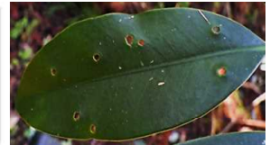
②穿孔性病害(原因不明)