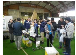
イタドリ茶の試飲

特にイタドリ茶(花のお茶)の試飲や顕微鏡での生きたマツノザイセンチュウの観察は好評でした。(池田)