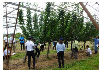
現地検討会の様子

東北地方でも鳥獣害の増加に伴い、対策に関する試験研究を立ち上げる機運が高まってきています。今回、依頼を受け山形県で開催された本会にて、和歌山県の獣害に対する取り組みについて講演を行い、熱心に聴講頂きました。（法眼）