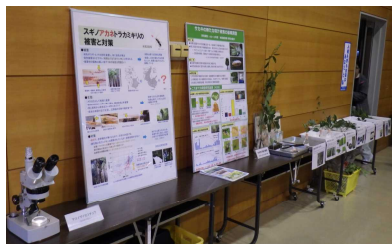
パネル等の展示状況

②本県で被害が深刻なスギノアカネトラカミキリと防除事業が継続している松くい虫について法眼主査研究員、松くい虫に対する抵抗性マツの選抜および育種について竹内研究員が説明を行いました。