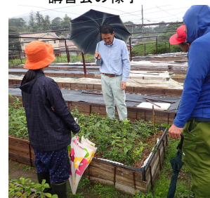
中辺路試験地の見学

平成29年度は10名の生産希望者が参加し、林業種苗生産に係る法的な規則や生産技術について講義を行ったほか、実際に種苗生産の現場を見学しました。（竹内）