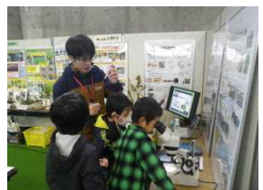
マツノザイセンチュウの観察