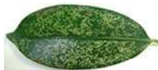
③白点(オビヒメヨコバイ族の一種による吸汁被害) 体長約4mm