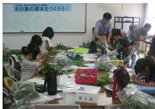
木の葉の標本作り