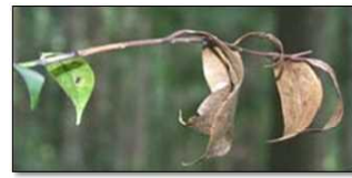
①枝枯れ症状(原因不明)

最近、特にサカキの新芽・新葉等を加害する新たな病害虫が県内を問わず発生しています。