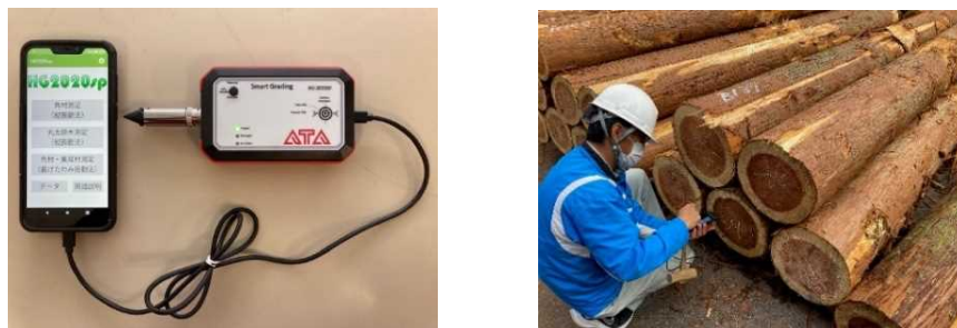
図 1 原木ヤング係数の測定

測定は令和 3 年 6 月から令和 4 年 1 月にかけて毎月 1～2 カ所の原木市場で実施し、スギ 6,461 本 (1,781m 3 )、ヒノキ 5,915 本 (1,096m 3 )、合計 12,376 本のデータを収集した。この量は令和 2 年の製材用素材年間生産量の 3%弱に相当した。そして、樹種、径級別等に集約、分析を行うことで、ヤング係数の分布状況を推測するためのデータベースを構築することとした。