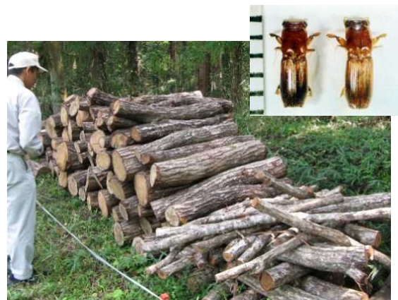
カシノナガキクイムシ防除試験