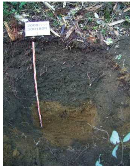
森林土壌の蓄積炭素量調査