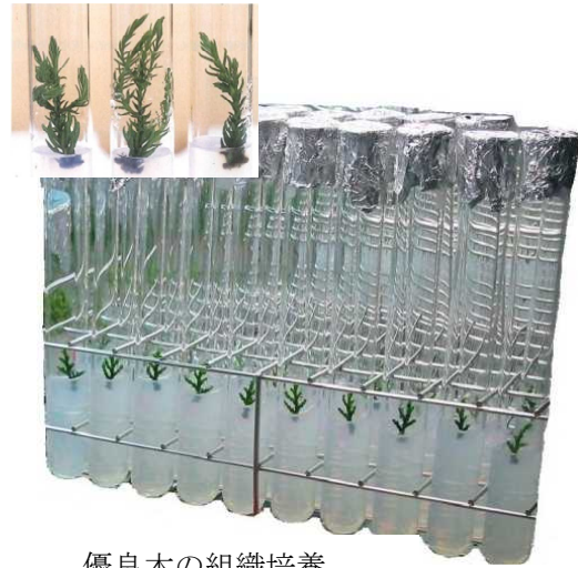
優良木の組織培養