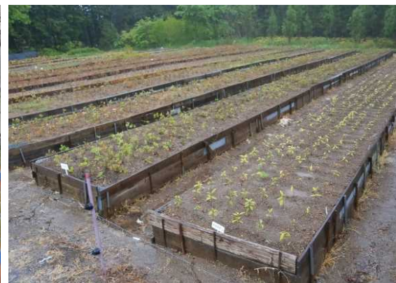
広葉樹苗木の生産