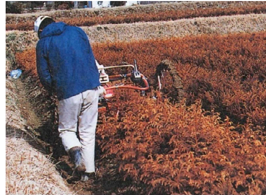
山行苗木の根切風景