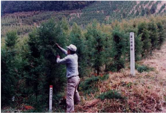
スギ採穂園での採穂作業