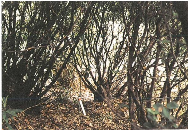
ウバメガシ萌芽試験林