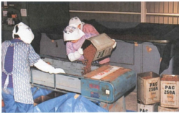
球果乾燥と種子精選