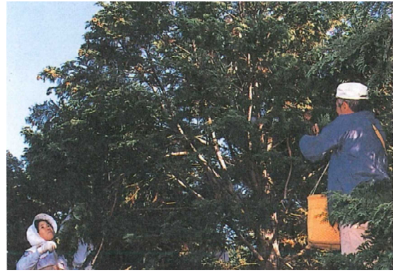
採種園での球果採取作業