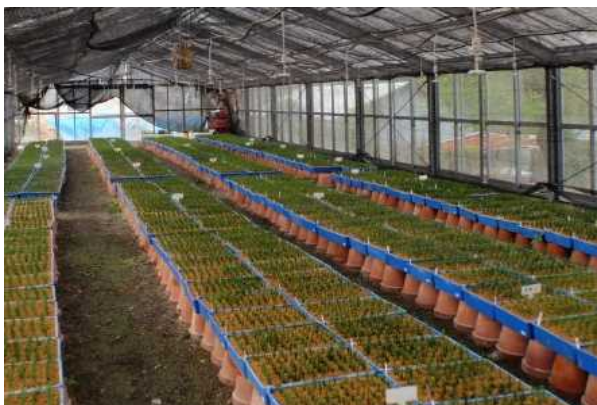
マイクロカッティングによる 少花粉スギの増殖