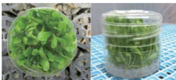
写真1 鉢上げ前の発根培養苗

定植2週間後の抽苔株率は、‘紀州ファインバイオレット(FV)’、‘紀州ファイングレープ(FG)’、‘紀州ファインパープル(FPu)’では、クーラー区の100%に対してなりゆき温度区が56.3～75%と低く、抽苔本数もクーラー区よりも少なくなりました(表1)。他の5品種では、両育苗区の抽苔株率や抽苔本数は同等となりました。しかし、‘紀州ファインピンク(FPi)’は、なりゆき温度区では抽苔花茎の除去を終了した後、草勢が旺盛となり、抽苔本数が著しく少なくなりました（データ省略）。