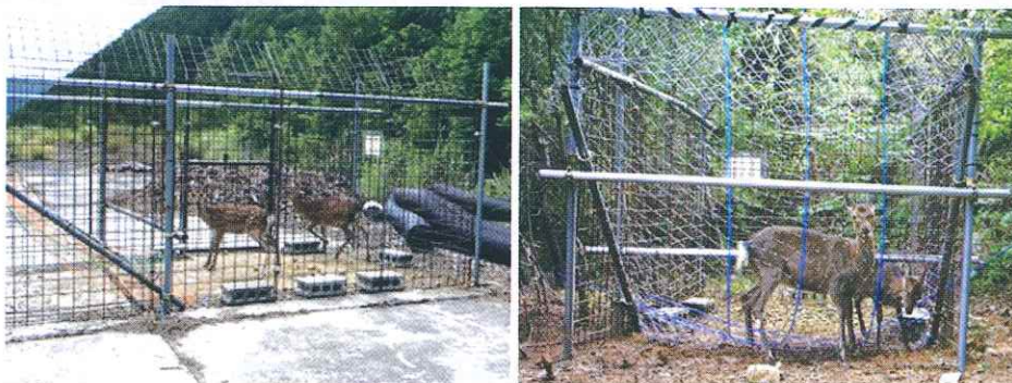
図4 捕獲されたシカの状態