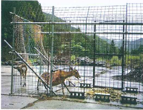
図3 ワナへのシカの侵入