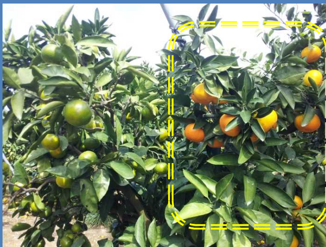
着色が早く樹勢の良い「ゆら早生」