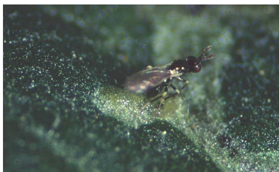
写真1 マメハモグリバエ幼虫に産卵するイサエアヒメコバチ成虫