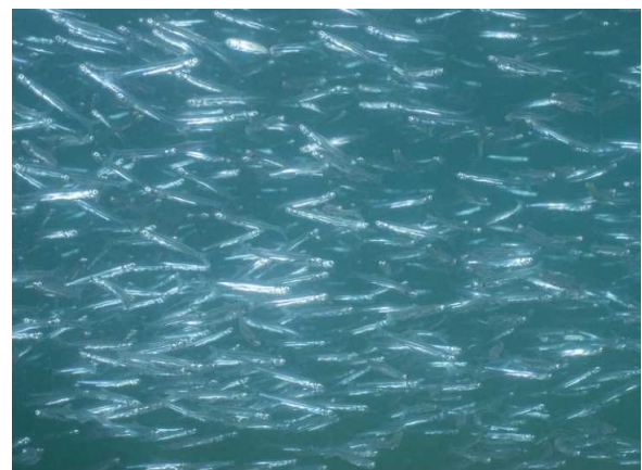
(海中を泳ぐアユ稚魚)