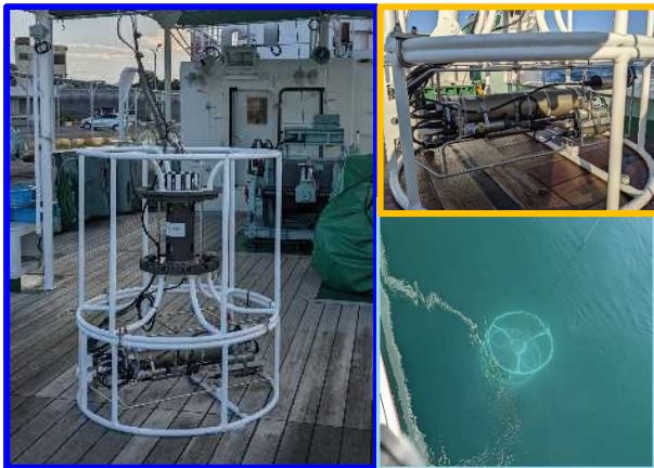
(調査船「きのくに」搭載の海洋観測装置)