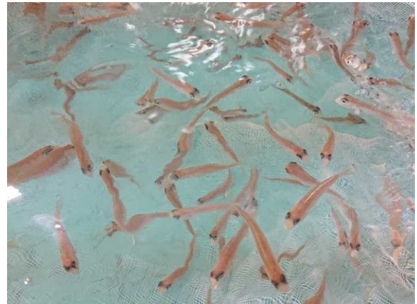
(シロアマダイ稚魚)