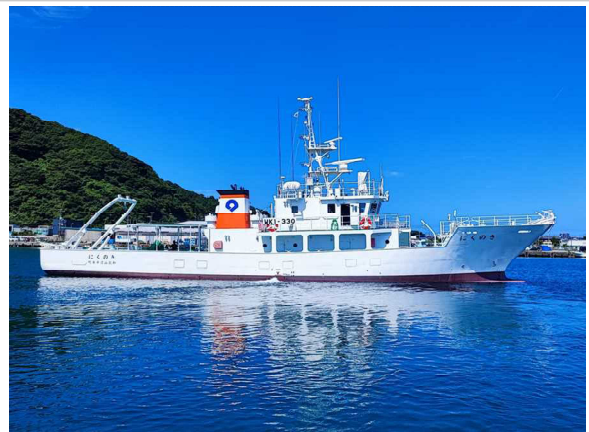
(漁業調査船「きのくに」)