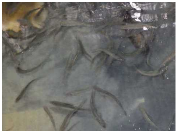
(摂餌中の供試アユ)