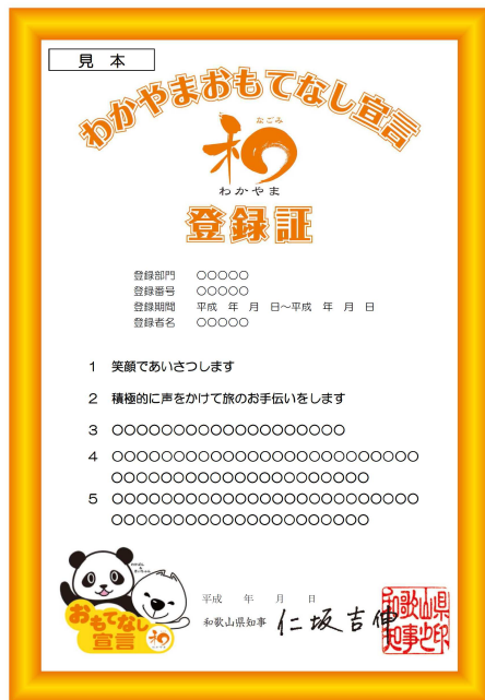
わかやまおもてなし宣言登録証