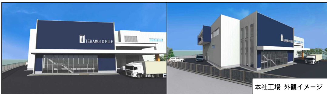
本社工場 外観イメージ