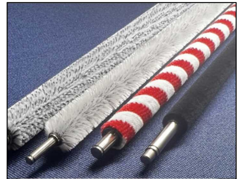
クリーニングブラシ （ロールブラシ）