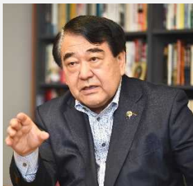
寺島 実郎 氏