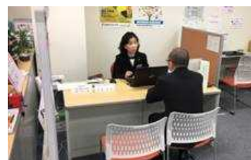
正社員化総合相談窓口 （2018.10 開設）