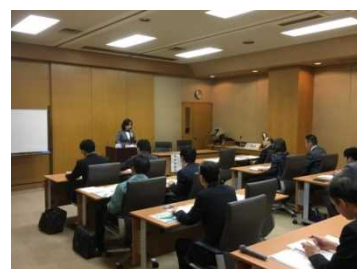
正社員化セミナー （2019.8 開催）