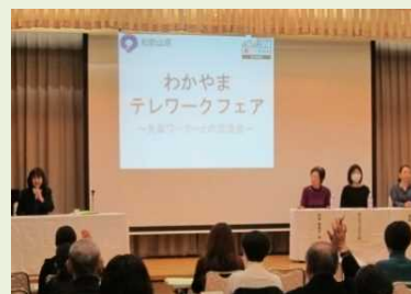
わかやまテレワークフェア (2018. 2. 9)