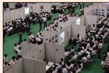
応募前サマー企業ガイダンス (2017. 6. 16)