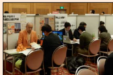
わかやま就活サイクルプロジェクト 合同企業説明会（2018. 2. 14）