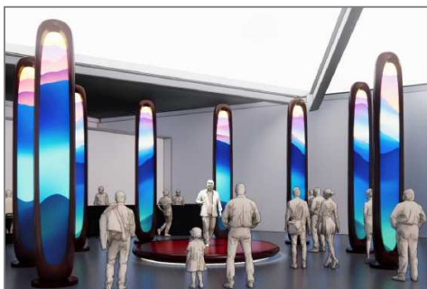
【和歌山ゾーンイメージ図】