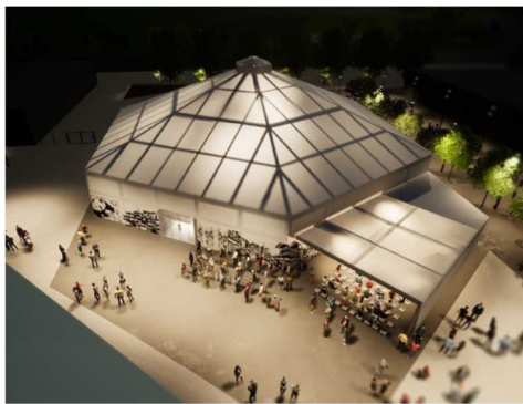
【関西パビリオンイメージ図】