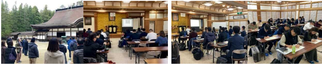
高野町の歴史・建造物ガイドツアー、高野町関係者の講話 マインドフルネス研修、写経体験

高野町の魅力を発見・再認識することを目的とした、高野町関係者の解説によるガイドツアーや講話を実施。その後、各企業のリソースを活かした高野町の新たな価値創造ワークに取り組んだ。その他、マインドフルネス研修や写経体験といったウェルビーイングに関するカリキュラムを実施し、高野町特有の雰囲気を感じつつワーケーション体験ができる機会を提供した。