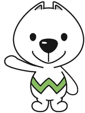
和歌山県PRキャラクター 「きいちちゃん」

中小企業の皆さんの負担を軽減するため、「低利・固定・長期」の資金とし、信用保証料についても県が一部負担しています。