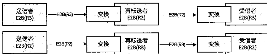
図2：再転送の使用事例

このような場合、変換において、できる限りデータの完全性を保証しなければならない。すなわち、情報の消失がわずかであることが求められる。再転送者によって情報が更新される場合を除き、理想的には最初のメッセージと転送されるメッセージは内容に関して同一であることが必要である。