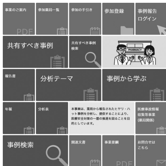
図表IV-1 本事業のホームページ

本事業では、事業計画に基づいて、報告書や年報、共有すべき事例、事例から学ぶ等の成果物や、匿名化した報告事例等を公表している。本事業の事業内容の掲載情報については、パンフレット「事業のご案内」に分かりやすくまとめられているので参考にさせていただきたい ( http://www.yakkyoku-hiyari.jcqh.or.jp/pdf/project_guidance.pdf )。