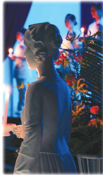
ナイチンゲール像