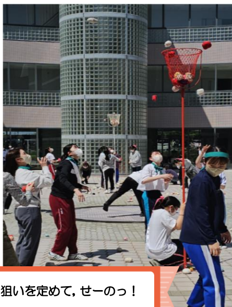
狙いを定めて、せーのっ！