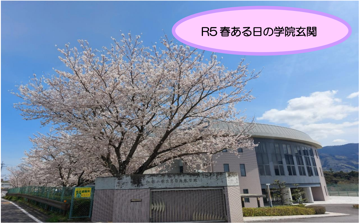
R5 春ある日の学院玄関