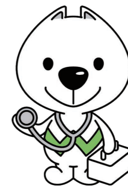
和歌山県 PRキャラクター 「きいちゃん」