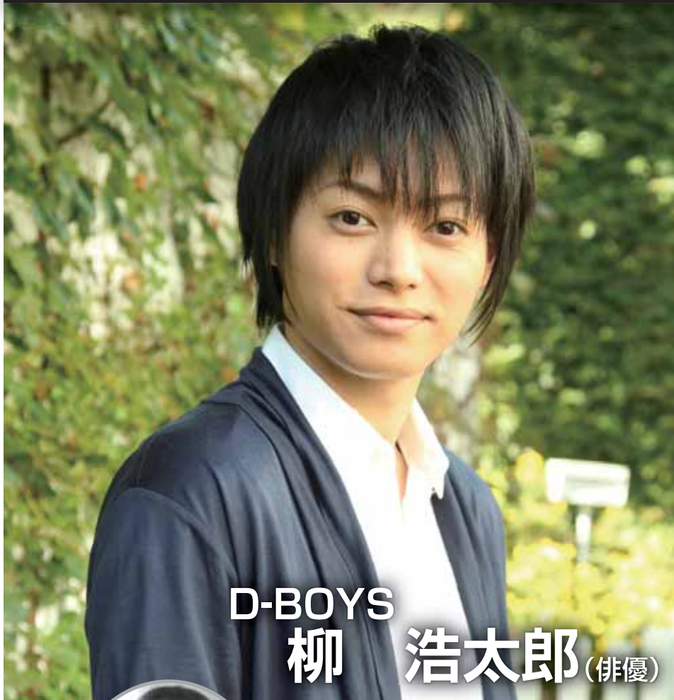
D-BOYS 柳 浩太郎 (俳優)

「見えない障害」とも言われるように外見からはわかりにくい高次脳機能障害について、 わかりやすく解説、その理解と対応方法について学びます。 また高次脳機能障害と向かい合いながら舞台に立つ体験談を聴き本当に必要な「理解」とは何か。一緒に考えます。