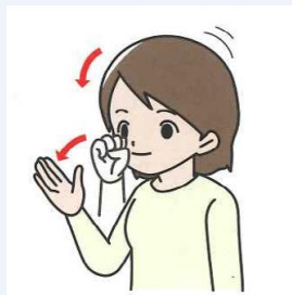
よろしくお願いします