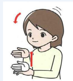
ありがとうございます