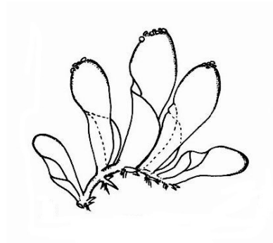
ボウズムシトリゴケ（CR+EN） （土永（1991）典拠）