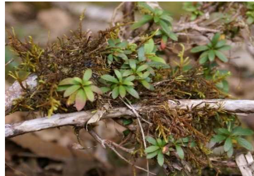
カワブチゴケ (NT) (土永浩史)