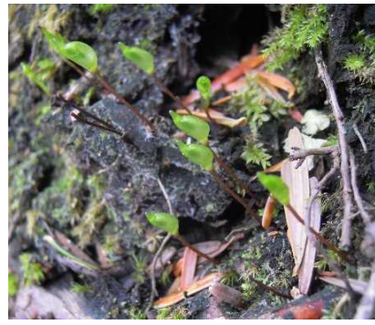
ウチワチョウジゴケ (キセルゴケ) (CR+EN) (土永浩史)