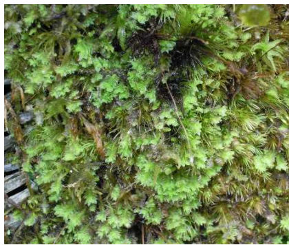
オヤコゴケ (NT) (土永浩史)