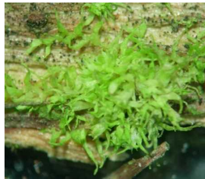
ナガバムシトリゴケ（CR+EN） （土永浩史）