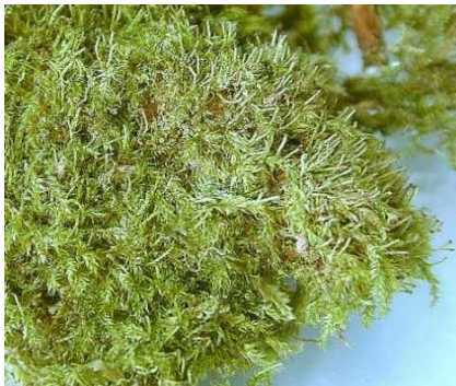
コモチイチイゴケ (NT) (土永浩史)