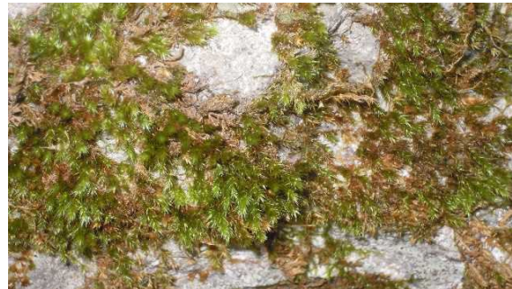
ヤクシマナワゴケ (CR+EN) (土永浩史)