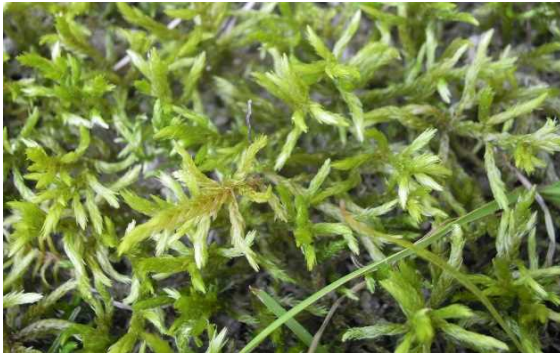
フロウソウ (CR+EN) (土永浩史)