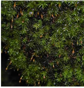
フウリンゴケ (CR+EN) (土永浩史)