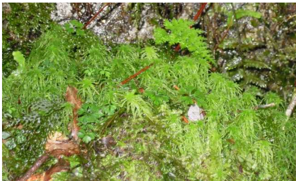
コバノホソベリミズゴケ (NT) (土永浩史)