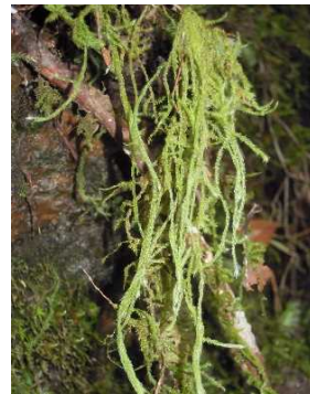
トサノタスキゴケ (NT) (土永浩史)