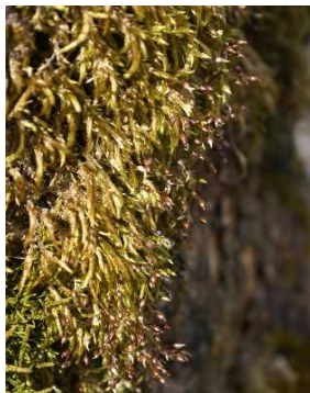
オオミツヤゴケ（VU） （土永浩史）