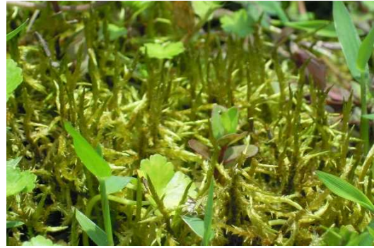
ヤリノホゴケ (CR+EN) (土永浩史)