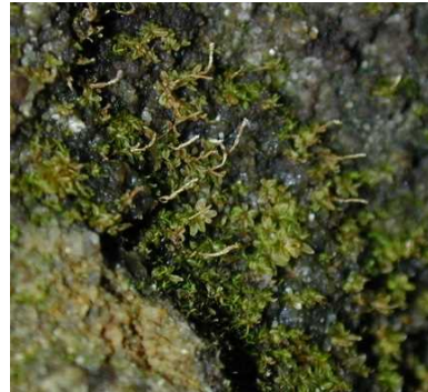
フガゴケ (CR+EN) (土永浩史)