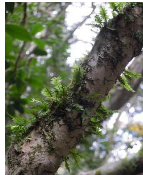
キジノオゴケ（VU） （土永浩史）