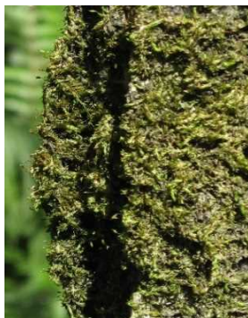
マムシゴケ (CR+EN) (土永浩史)