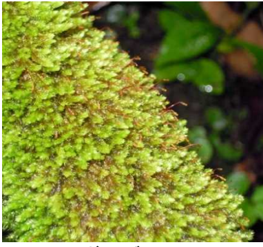
ハシボソゴケ (VU) (土永浩史)