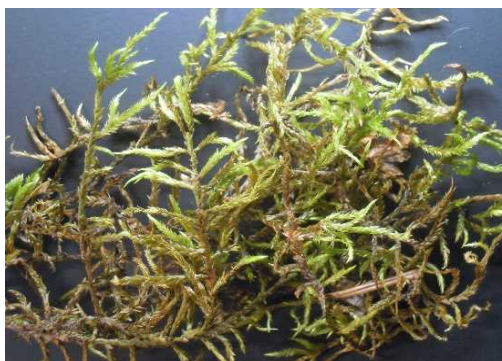
タチハイゴケ (DD) (土永浩史)