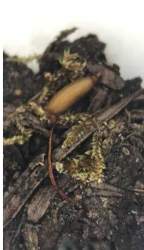
クマノチョウジゴケ (CR+EN) (土永浩史)