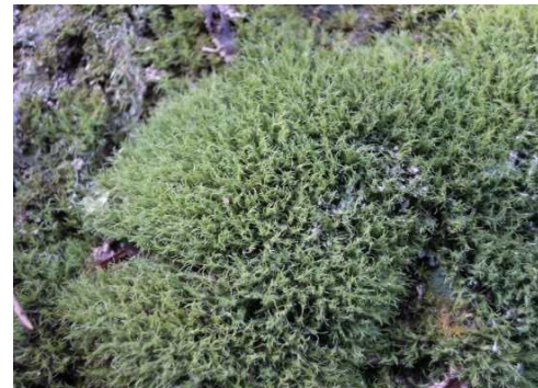
イサワゴケ (NT) (土永浩史)