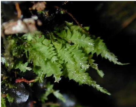
コキジノオゴケ (NT) (土永浩史)