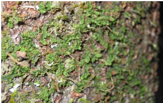
キノボリツノゴケ（CR+EN） （土永浩史）