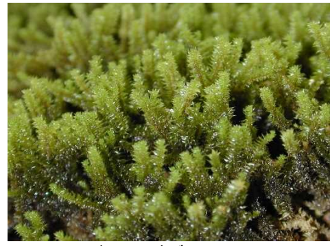
トゲアイバゴケ (VU) (土永浩史)