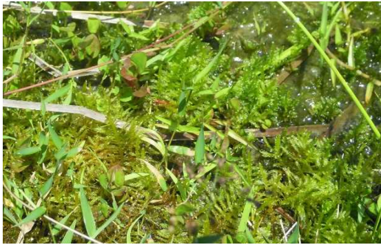
ササオカゴケ（アオモリカギハイゴケ） （CR+EN） （土永浩史）