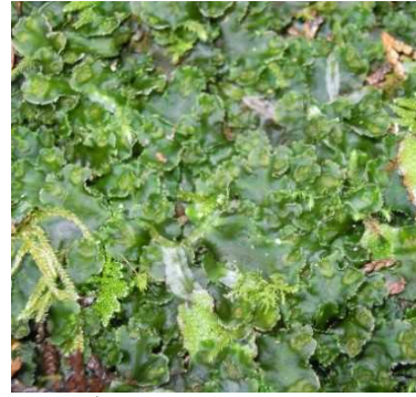
シャクシゴケ（ミドリシャクシゴケ） （CR+EN） （土永浩史）