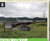
8 明治の大水害の際に流されたきた樹齢500年とも言われるクスノキの大木。平成11年の南紀熊野体験博でモニュメントとして披露された。