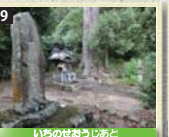
9 平安・鎌倉時代の熊野詣では富田川を最初に渡るのが一ノ瀬であったといわれ、水垢離場として重んじられた。