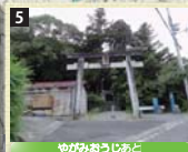
5 熊野九十九王子の1つで、現在は八上神社と呼ばれている。11月の例祭で奉納される獅子舞は県の無形文化財に指定されている。