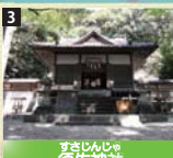
3 神武天皇即位の際に祭祀された万呂3ヶ村の鎮守。主祭神は須佐之男命。豊田秀吉の紀州平定の際も焼討を免れた。