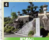
4 紀州善光寺とも呼ばれる寺。約1万坪の境内には、西国33ヶ所の石仏や樹齢350年の大ソテツがある。※境内から熊野古道への通り抜けは不可。