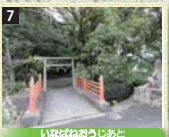
7 熊野九十九王子の中でも格式の高い五体王子の1つ。付近には、熊野詣に訪れた旅人が体を清めたという水垢離場がある。県の指定史跡。