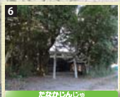
6 南方熊楠や柳田國男から称賛された本神社の森は、県の天然記念物第1号。裏手には大賀ハスの畑があり、毎年初夏には大輪の花を咲かせる。