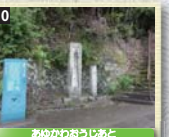
10 鮎川の名称は、川が合流する場所合川(あいかわ)に由来するとされ、文字通り富田川が支流と合流する場所に王子跡を示す碑がある。県の指定史跡。