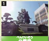
1 稲南地域の中心都市である田辺市は、武蔵坊弁慶の生誕地とされ、南方熊楠が暮らした地としても有名。写真はJR紀伊田辺駅の駅前広場にある弁慶像。