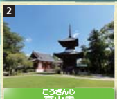
2 弘法大師の開創とされ、「弘法さん」の名で親しまれている。境内には江戸時代建立の美しい多宝塔があり、南方熊楠や楠芝盛平の墓もある。