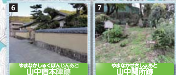
6 やまなかじんじゅと山中信本陣跡

徳川頼宣が紀州藩主になって以来、参勤交代時の本陣として使われた場所。当時は旅館ではなく、一時休憩や昼食のため使われた。※一般開放はされていない。