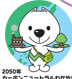
2050年カーボンニュートラルわかやま