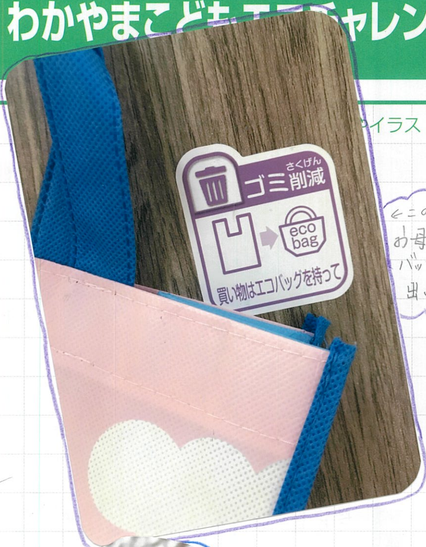
イラスト (自由記入)

このシールをはる事で お母さんは、ちゃんとエコ バッグを持って「くまめ」 出しました!!