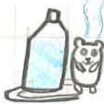
肥料として使いました。