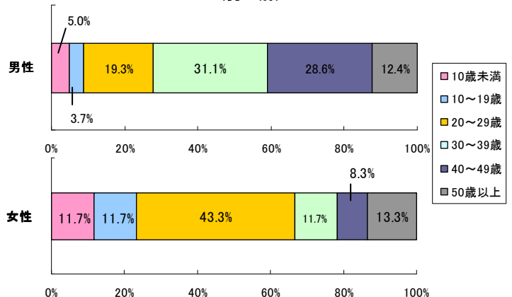
県内における年代別風しん患者累積報告数の割合(男女別)

また、保健所では和歌山市保健所管内が172人と全体の77.8%を占めています。次いで、湯浅保健所管内が13人(5.9%)、海南保健所管内が12人(5.4%)となっています。