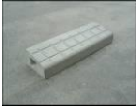
歩車道乗り入れ斜型スベリ止付