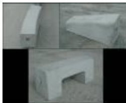
歩車道境界ブロック(役物)