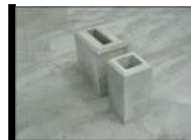
フェンス用基礎ブロック