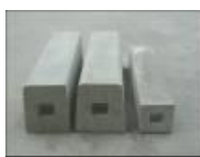
歩車道境界ブロック