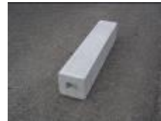
地先境界ブロック