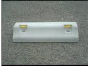
セイフティーストッパー